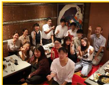
じゃんけん大会!! 優勝するぞ~