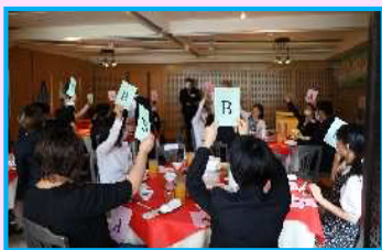
自己紹介クイズで 盛り上がっています♪