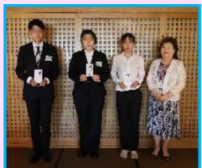
初就職・進学お祝品贈呈