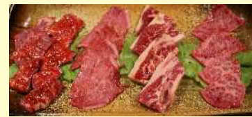
★豪華なコース料理★