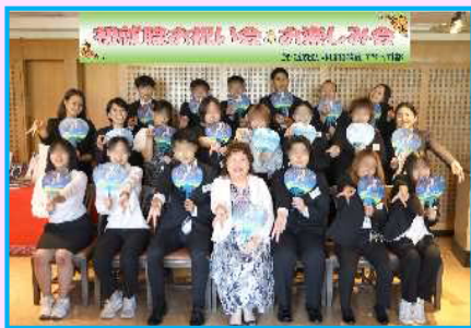
最後は、記念うちわを持って記念撮影