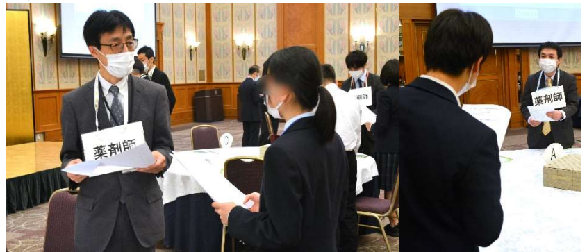
講 義：「身近におこる体のトラブルと対処法について」 実 習： ロールプレイング「体調不良時の症状の伝え方」