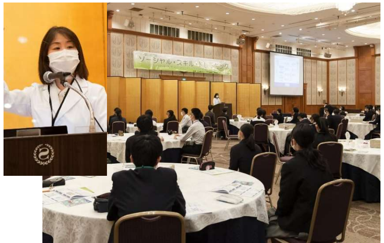
講 義：「くすりの基本知識について」