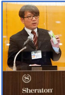
実 習：「自分の平熱を知ろう！」体温のはかり方、体温計の使い方 講 義：「正しい手指の消毒」