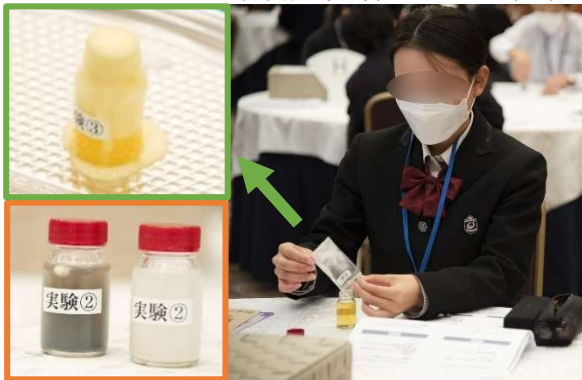
実 験：「くすりの飲み方について」