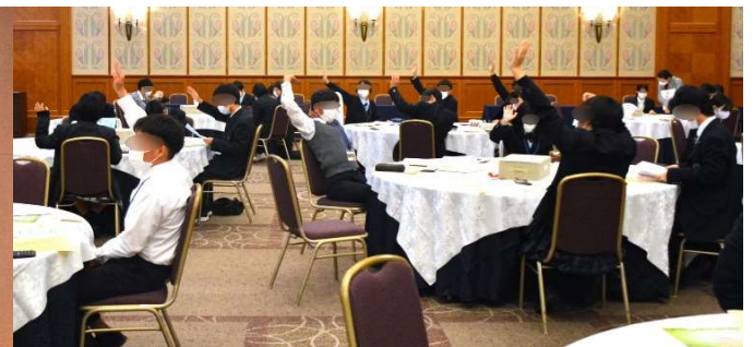
講義：「働くとはどういうことか」では就職活動・入社後の大切な事を学びました。