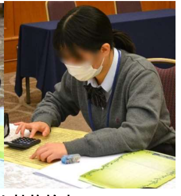
実習：「CaPt-Y 性格検査」 自分の長所や短所など、確認する事が出来ました。