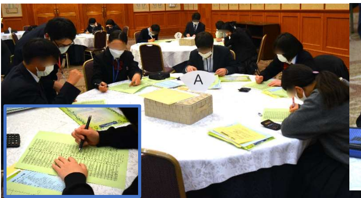
実習：「Prep-Y 職業興味検査」 自分がどんな職業が適性しているかがわかりまし