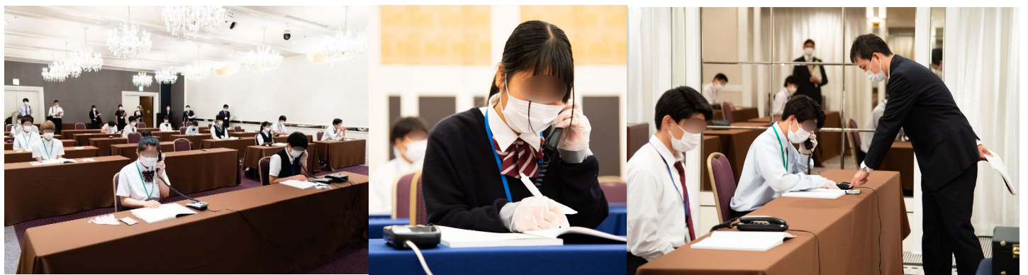
実習④：電話対応「必ずメモを取ること（特に先方の社名・名前等）の大切さを教わりました。」