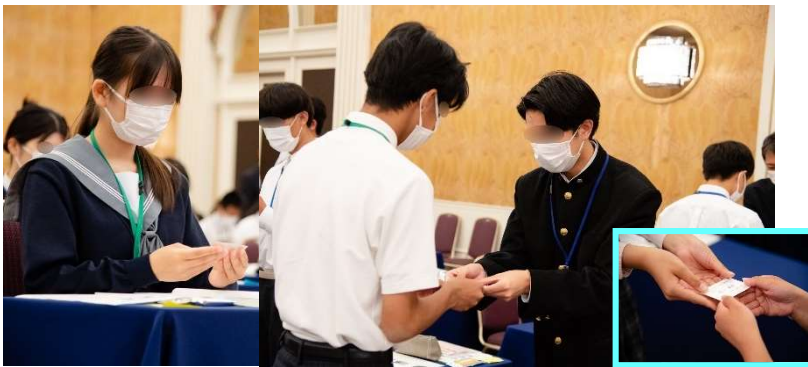
実習②：正しい名刺交換の仕方 「相手の会社名や名前を手で隠さない様に受取ります。」