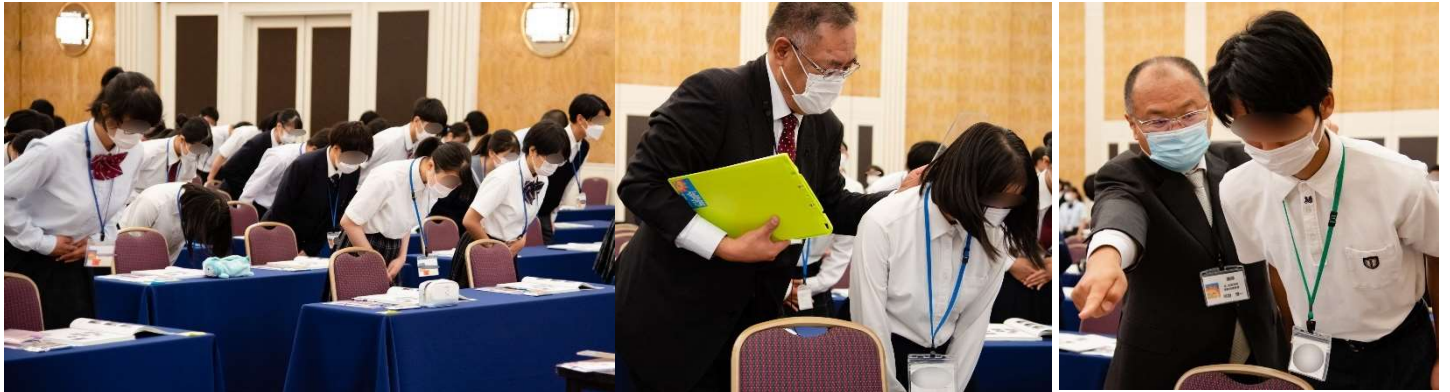
実習①：美しいお辞儀「きれいな姿勢でお辞儀ができるように、一生懸命練習しました。」