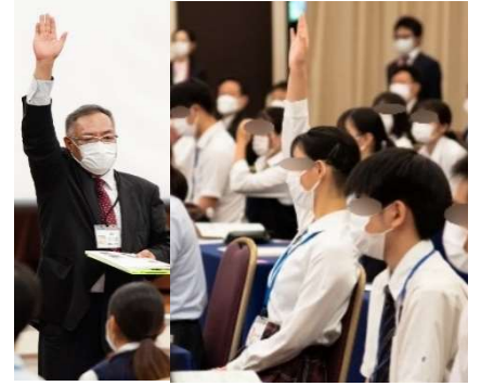
点呼：講師の見本を見て、姿勢良く大きな声で返事が出来ました。