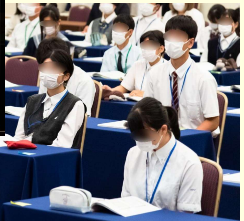
スクリーンで相手にどのように映っているのかを確認し、オンライン面接での注意点を学びました。