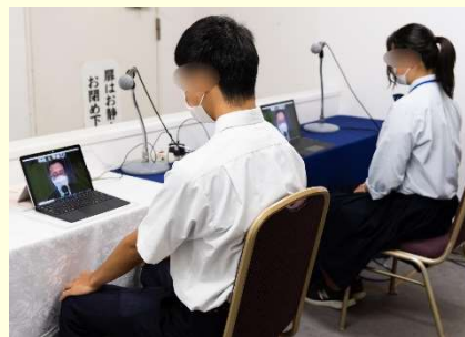
初めてのオンライン面接で緊張気味です。