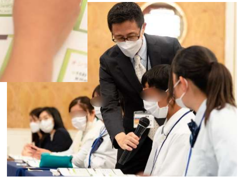
敬語の使い方についても詳しく教えていただきました。