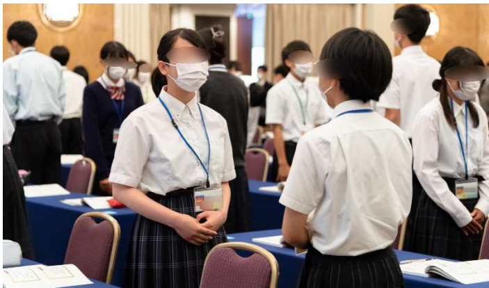
実習：「あいさつをしてみよう」