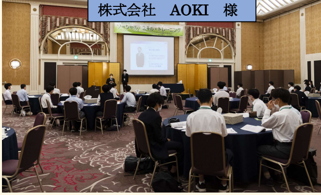
株式会社 AOKI 様