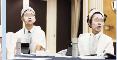
スキンケアで肌のお手入れ♪ バックを使うのは初めてです！