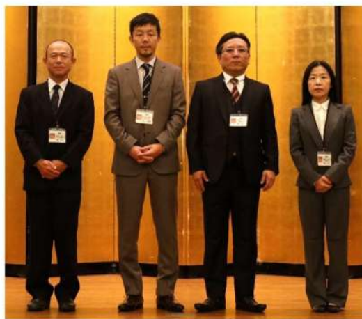
講師：有限会社 SIRIUS の皆様