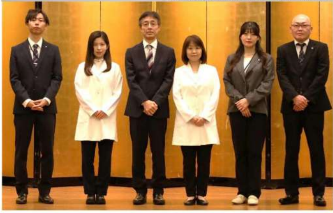
講師：森下仁丹株式会社の皆様