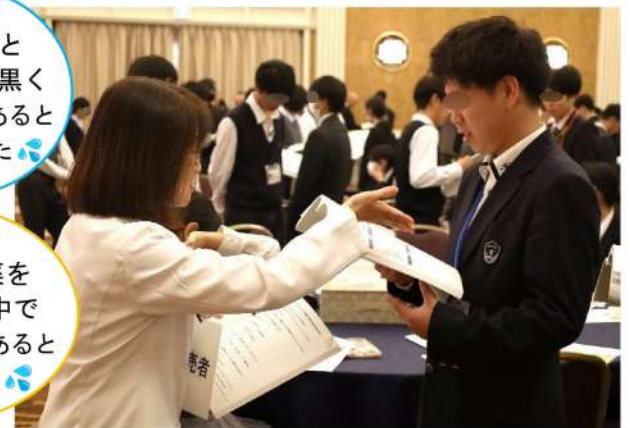
実習：ロールプレイ「体調不良時の症状の伝え方」