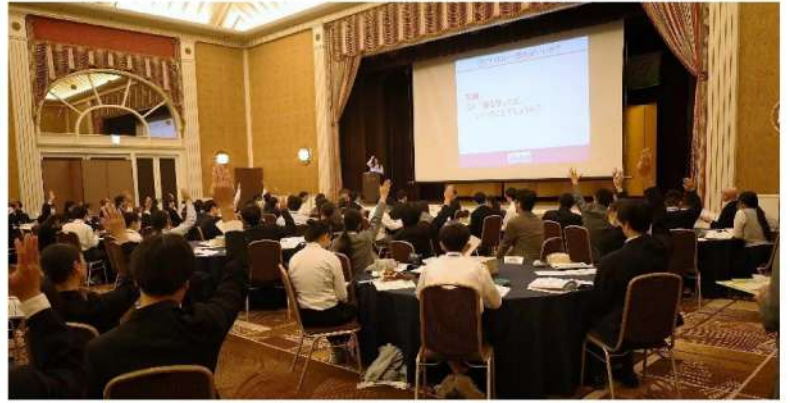
講義：「くすりの基本知識について」