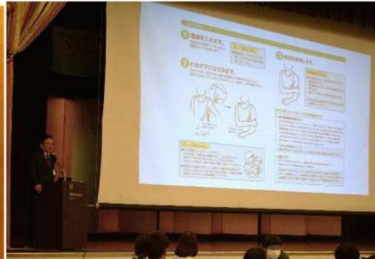
講義・実習：「自分の平熱を知ろう！」 正しい体温の計り方、体温計の使い方を教えていただきました。