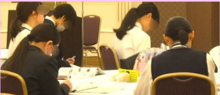
講義：マナー・スーツの着こなしとお手入れ スーツの着こなし方やお手入れの方法を学びました。