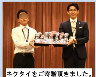
ネクタイをご寄贈頂きました。