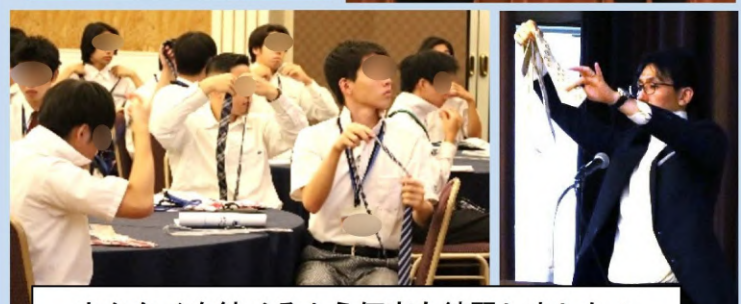
ネクタイを結べるよう何度も練習しました!