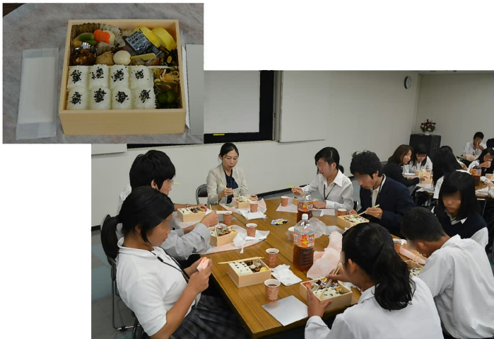
昼食:和食屋さんの特製オリジナル弁当 特別に作っていただいたお弁当をみんなで美味しくいただきました!