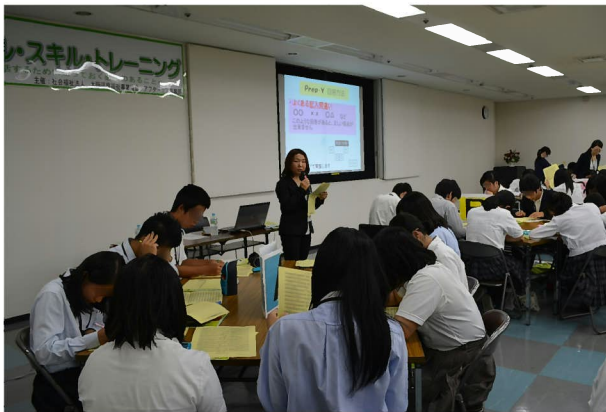
検査結果を自己採点し、自分の職業適性がわかりました。