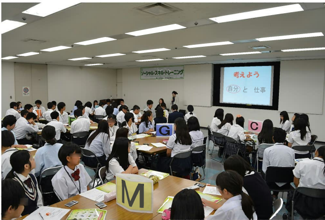
講義:自分に合った仕事えらびのために