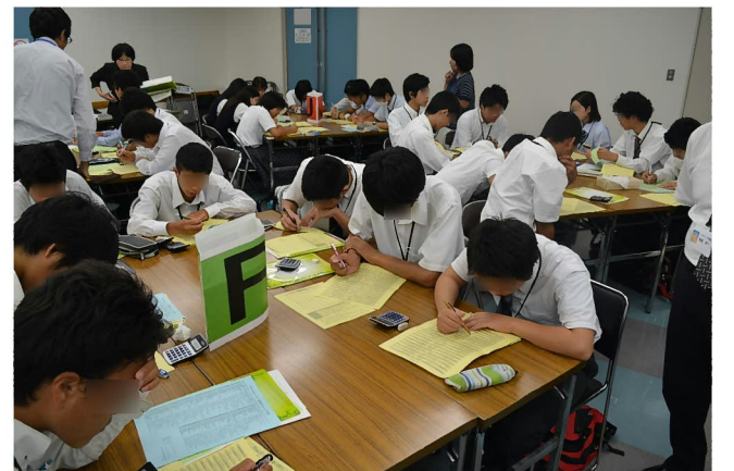
実習:職業興味検査・性格検査