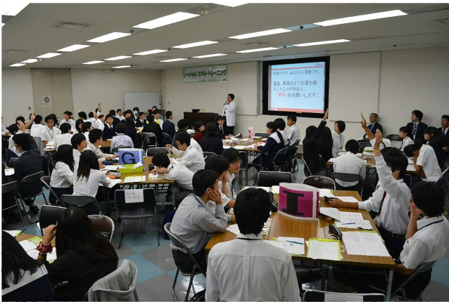
講義「お薬の基本知識について」 「身近におこる身体のトラブルと対処方法について」