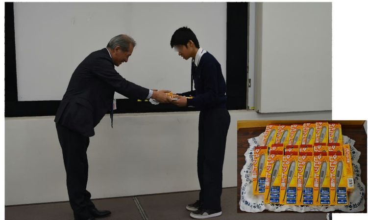
記念品贈呈: 受講記念に電子体温計を頂きました。