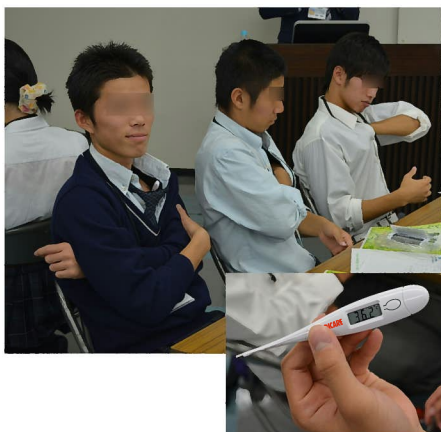
実習:「自分の平熱を知ろう!」 体温のはかり方・体温計の使い方