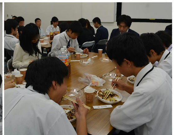
昼食: 熱々のお好み焼きをいただきました!