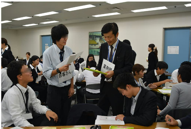
実習:ロールプレイ「体調不良時の症状の伝え方」