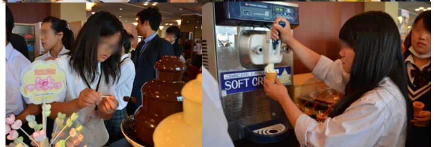
「豊富な種類のデザートがたくさん食べて、みんなの笑顔があふれていました♪」