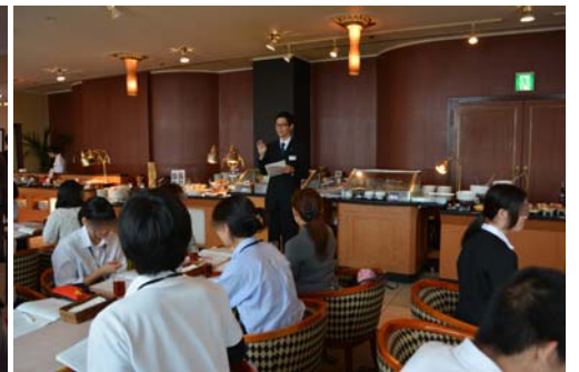
講習: バイキングのマナーについて