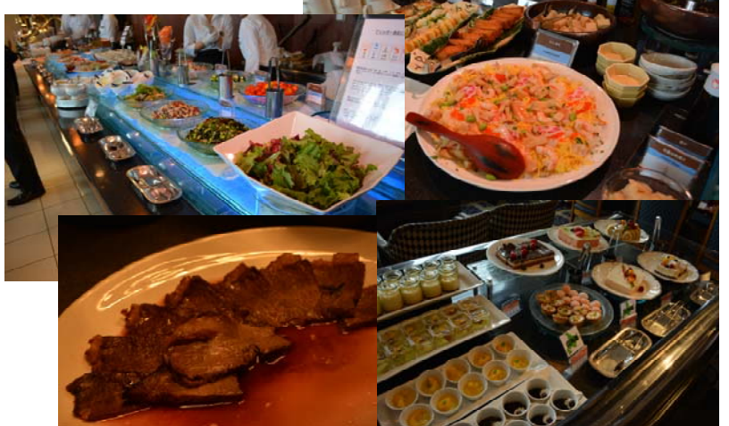
バイキング料理「たくさんのお料理から自分で好きなものを選ぶ楽しさを味わいました。」