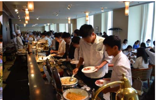
「初めてのバイキング体験♪お腹一杯になるまで何度も料理を取りに行きました！」