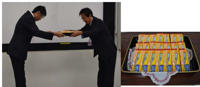
記念品贈呈: 受講記念に電子体温計を頂きました。