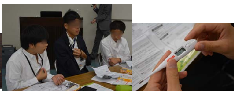
実習:「自分の平熱を知ろう!」 体温のはかり方・体温計の使い方