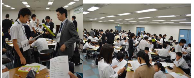
実習:ロールプレイング「体調不良時の症状の伝え方」