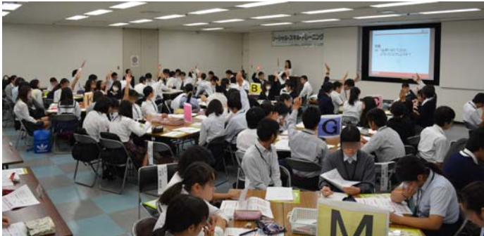
講義「お薬の基本知識について」