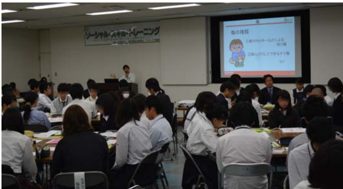
講義「身近におこる身体のトラブルと対処法について」