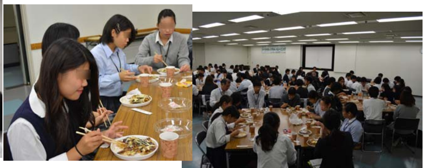
昼食: 熱々のお好み焼きはとても美味しかったです!