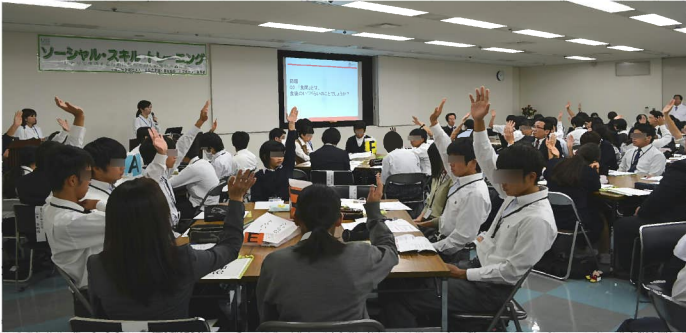
講義: 「お薬の基本知識について」