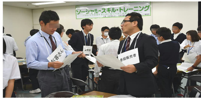
実習: ロールプレイング「体調不良時の症状の伝え方」