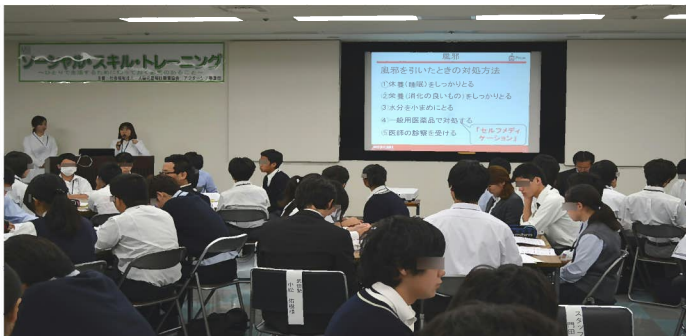
講義: 「身近におこる身体のトラブルと対処方法について」