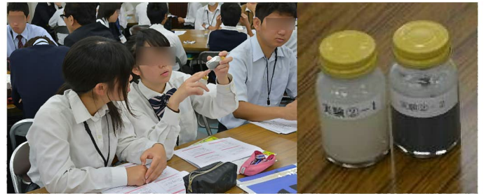
実験: 「薬の服用方法について」 お茶で薬を飲むと胃の中で黒く濁り、 正常に薬が働かないことがわかりました。