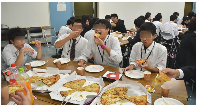
昼食: 出来立てのピザはとても美味しくて、完食しました!