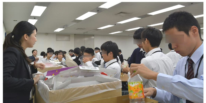
実習: ゴミ分別の仕方 スムーズに分別できるようになってきました。