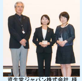
資生堂ジャパン株式会社 様 (公財)資生堂社会福祉事業財団 様