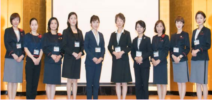
資生堂ジャパン株式会社 様