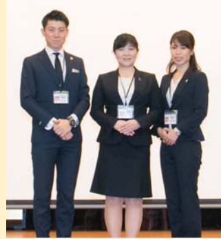
株式会社 AOKI 様