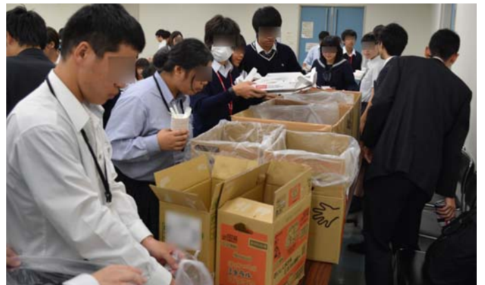
実習：ゴミ分別の仕方 自分たちで考えながら分別していますが、難しいです。