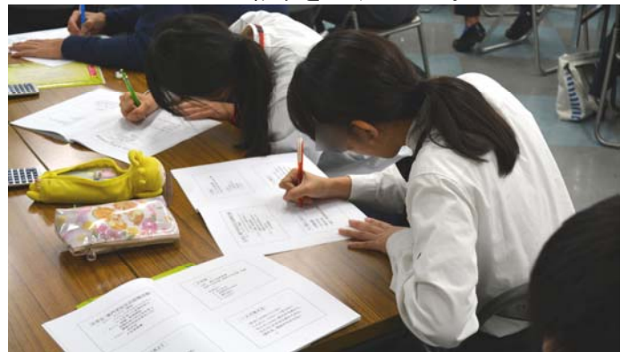
働く上で大切なことを書き留めました。