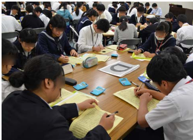
実習：職業興味検査・性格検査