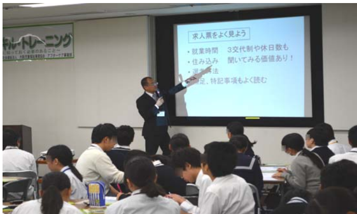
講義：「働くとはどういうことか」