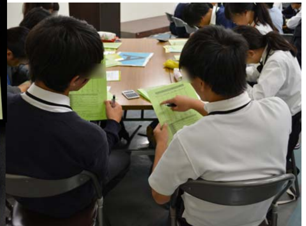
検査結果を自己採点し、自分に向いている職業を知りました。