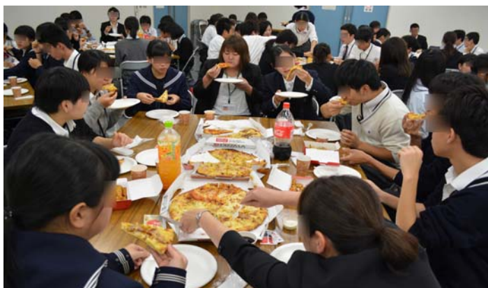
昼食は熱々の大きなピザ、ポテトフライ、シュリンプと盛りだくさんでお腹いっぱい♪