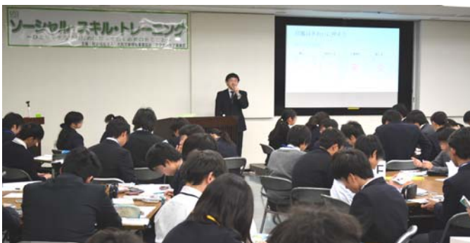
講義：「印鑑の取扱い・マイナンバーについて詳しく知ろう！」