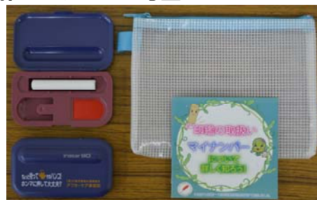
印鑑・印鑑ケース・ 収納ケース・印鑑マニュアル