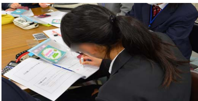
実習：「印鑑の押し方」