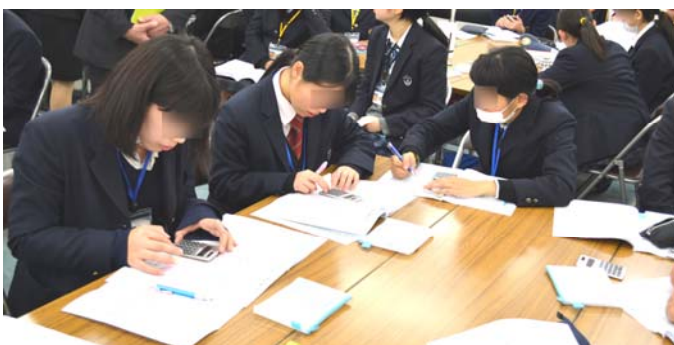
実習：「一人暮らしに必要な生活費のやりくり」