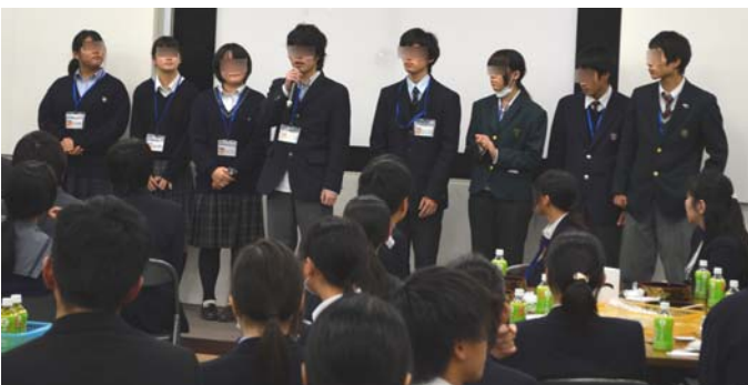
高校三年生は卒業後の進路をみんなに発表しました。 昼食のお寿司は1人1桶！みんな大喜びでした。