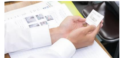
頂いた名刺の会社名や名前を手で隠さない様に丁寧に受取ります。