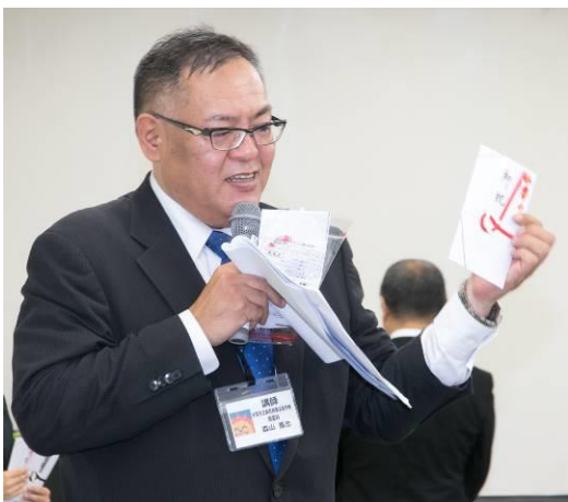
講義・実習③：祝儀・不祝儀袋の使い方 （祝儀袋にもマナーがある事を初めて教わりました。）