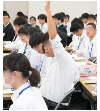
姿勢良く元気な声で返事