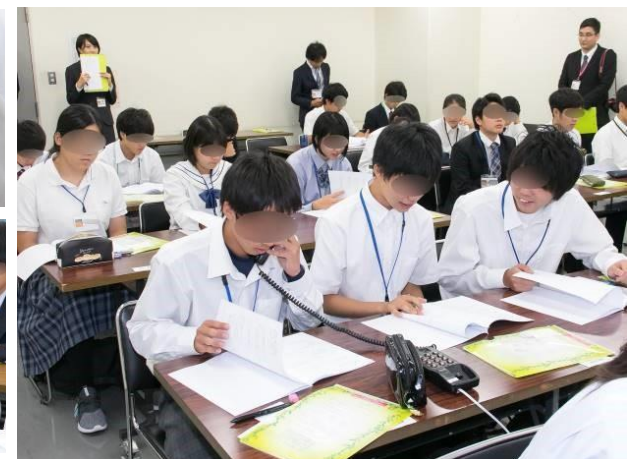
実習④：美しい電話応対 （メモを取る事の大切さを実感しました。）