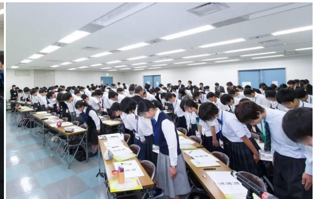
実習①：美しいお辞儀（きれいなお辞儀ができていないか講師の先生方が一人一人チェック！）