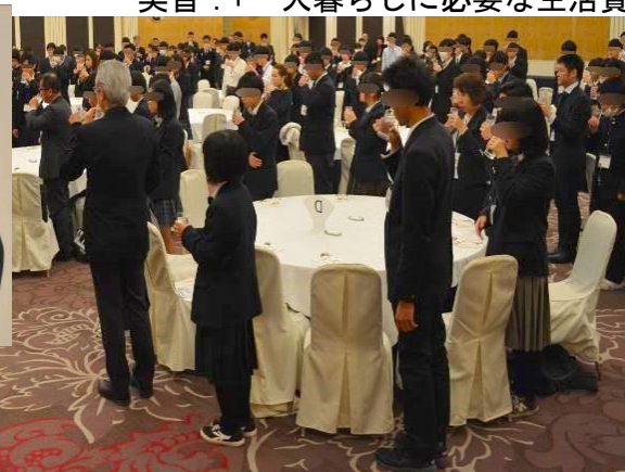
「乾杯！」と、一口飲んで拍手をします。