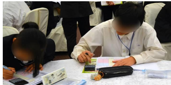
実習：「一人暮らしに必要な生活費のやりくり」