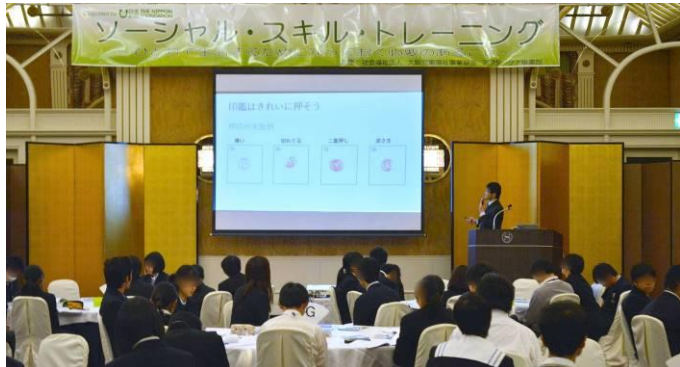
講義：「印鑑の取扱い・マイナンバーについて詳しく知ろう！」