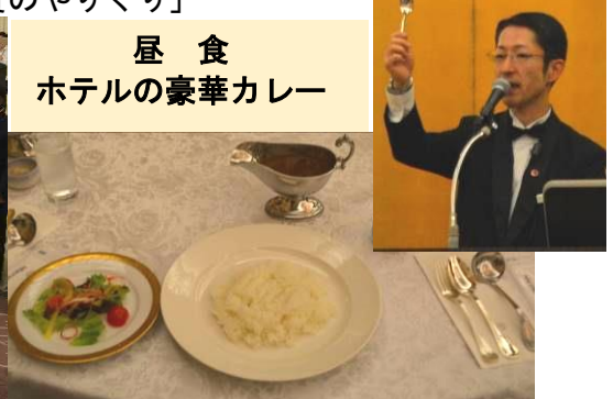
昼食 ホテルの豪華カレー