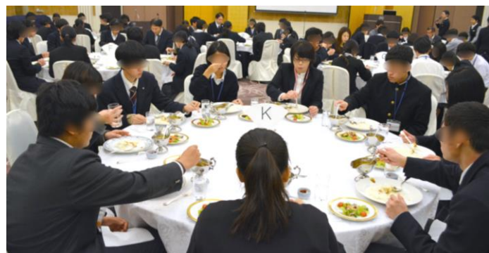
ホテルの美味しいカレーを頂きました。