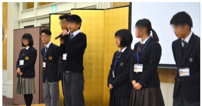
高校三年生は卒業後の進路をみんなに発表しました。