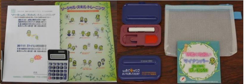
配布物：資料・クリアファイル・電卓・印鑑・印鑑ケース・ 収納ケース・印鑑マニュアル