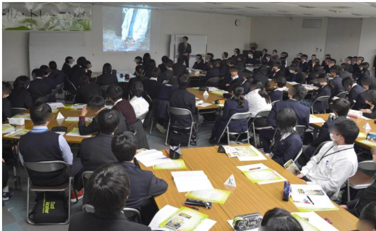
DVD鑑賞：実際のニュース映像を見て、 ヤミ金融の恐ろしさを実感しました。