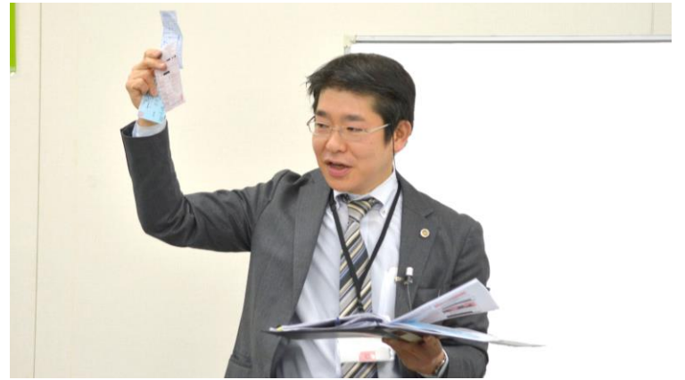
講義③：「健康保険（医療保険）、 そして社会保険の話」