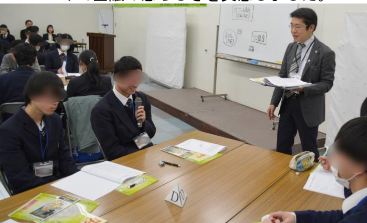
寸劇やDVDを見て大切な事は何か 皆に発表を致しました。