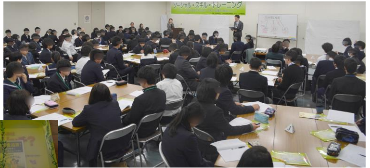
講義①：身近な法律の話 講義②：借金問題にはまらないために 詐欺被害に遭わないために