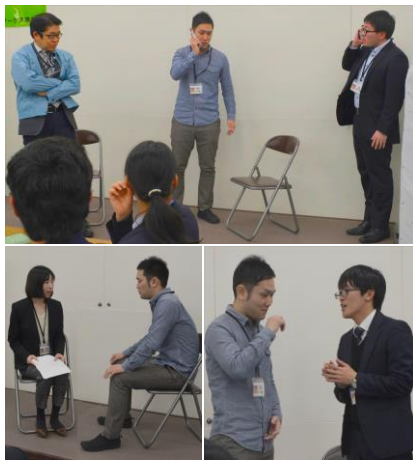
寸劇「まさのり君の失敗」