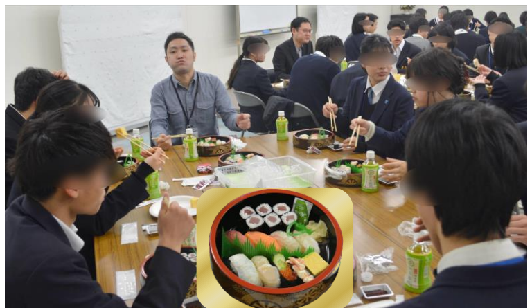
昼食のお寿司は1人1桶！ 普段お寿司は食べれないので、みんな大喜びでした。