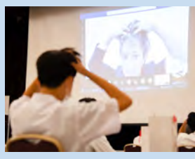
ヘアケア実習では実際にヘッドマッサージをしました。