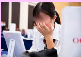
みんな真剣な表情でポイントメイク実習に取り組んでいます。