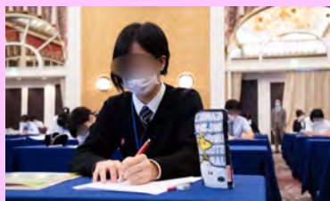
リモート講習では、しっかり講義を聞きました。