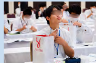
実習ポディシートでさっぱり！