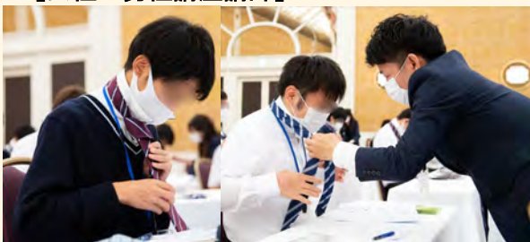
初めてネクタイを結び、悪戦苦闘中です！