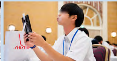
実習フェイスマッスルプログラム頑張中！