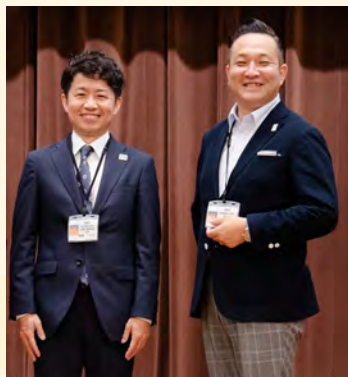
【女性・男性講座講師】