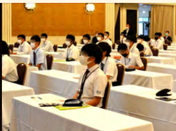
講義：マナー・スーツの着こなしとお手入れ