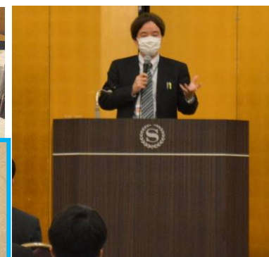
激励のことは 厚生労働省 子ども家庭局 家庭福祉課 課長補佐 胡内 敦司 様