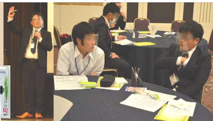
実 習：「自分の平熱を知ろう！」 体温のはかり方、体温計の使い方