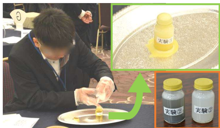
実 験：「くすりの飲み方について」