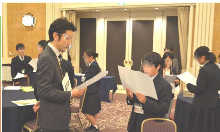
講 義：「身近におこる体のトラブルと対処法について」 実 習： ロールプレイング「体調不良時の症状の伝え方」