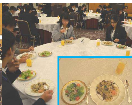
昼食は、ビーフピラフと野菜サラダを マナーを学びながら美味しく頂きました。