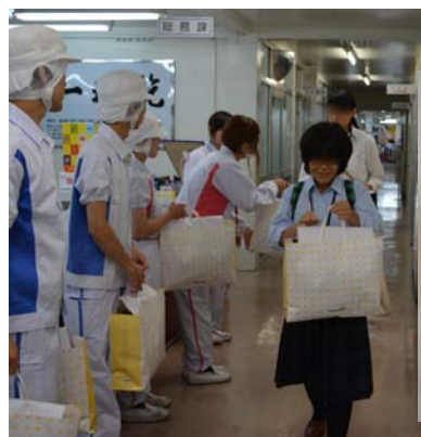
お土産に出来立てのパンをたくさん頂きました！