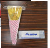
製造体験実習でクレープを作り、 美味しく頂きました！