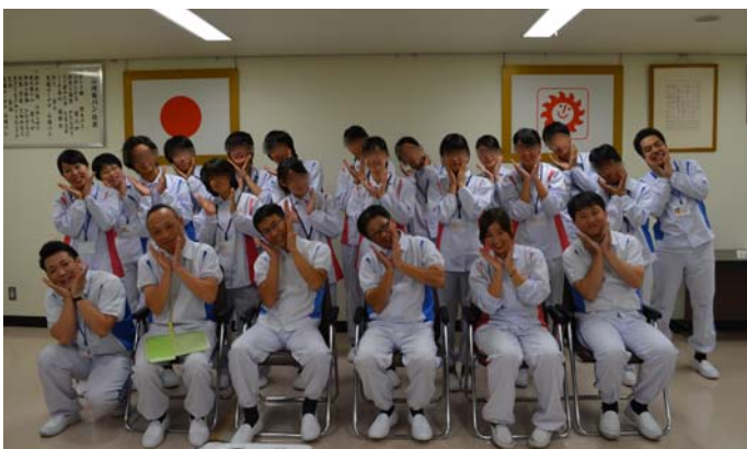
工場の制服を着て、全員で記念撮影♪