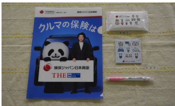
記念品を頂きました