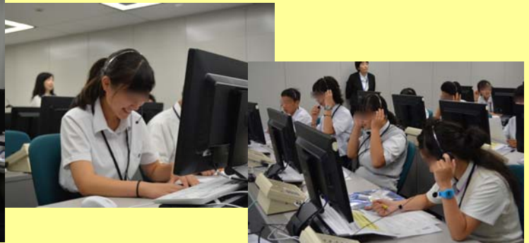
「はい、サポートセンターです。」「ご契約を確認いたします。」 初めてヘッドマイクをつけての会話にとっても緊張しました!!