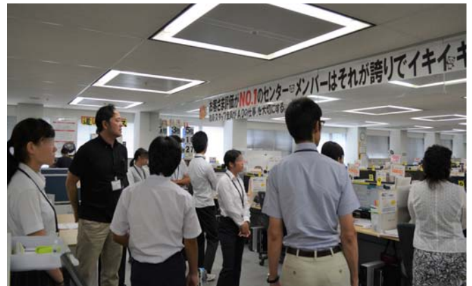
コールセンターを見学