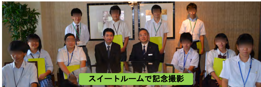
スイートルームで記念撮影