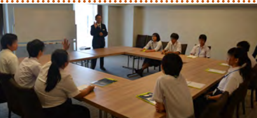
講習: まとめと振り返り 「前向きな気持ちを持つこと」 「笑顔で心掛けること」等、仕事を する上で大切なことを教えて頂きました。