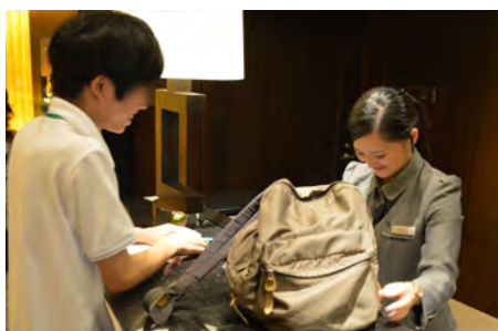
実習: クロークの利用方法