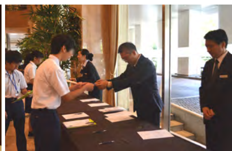
実習: チェックインの仕方