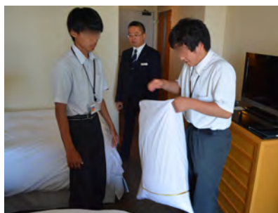
実習: ベッドメイキング