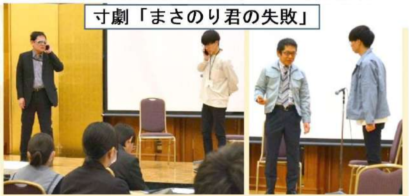
寸劇「まさのり君の失敗」