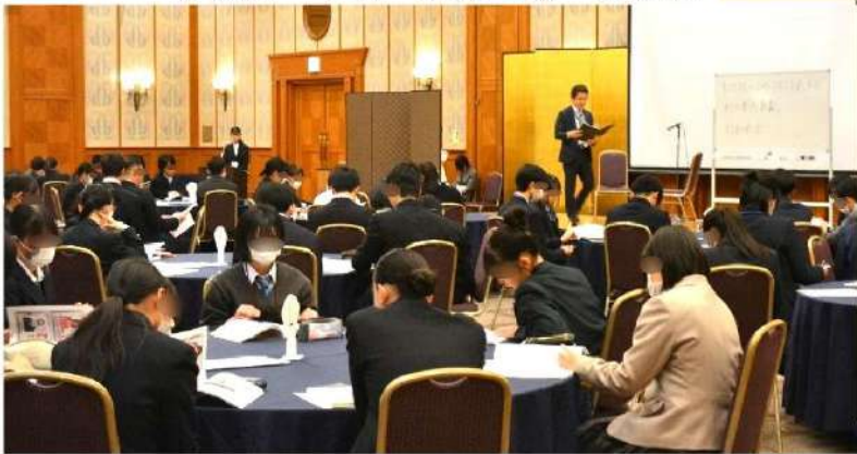
講義①：身近な法律の話 -サラ金やヤミ金融ってなに？- 講義②：借金問題にはまらないために 詐欺被害に遭わないために