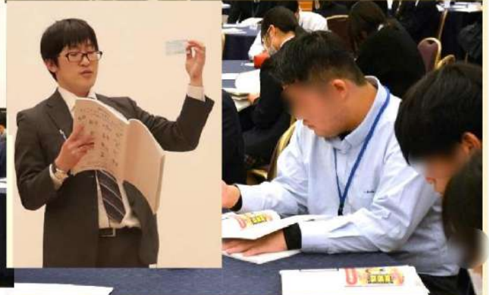
講義③：「健康保険（医療保険）社会保険の話」 医療保険の大切さを学びました。