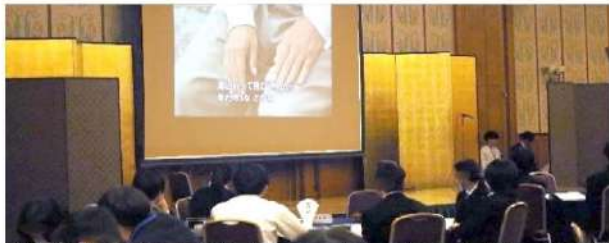
DVD鑑賞：実際の映像を見て、ヤミ金融の恐ろしさを肌で感じました。