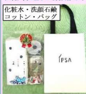
化粧水・洗顔石鹸 コットン・バッグ