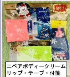
ニベアポディークリーム リップ・テープ・付箋