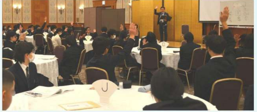
講義①：身近な法律の話 -サラ金やヤミ金融ってなに?- 講義②：借金問題にはまらないために 詐欺被害に遭わないために 闇バイトの怖さについて